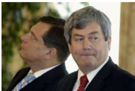
Jsou velká koalice, menšinová vláda ODS či „národní shoda“ skutečně v zájmu pracujících?

Že komunální politika není ani tak politika, jako spíš provádění praktických opatření? Ne, zabránit dalším privatizacím obecního majetku,